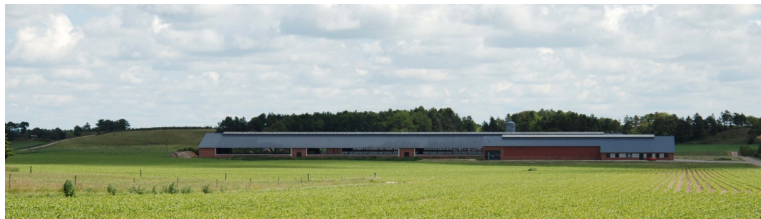
Eksempel på et samlet staldanlæg til malkekoer

Udfordringen er at se tingene i en helhed, med udgangspunkt i landskabet med dets former, linjer og beplantninger, i tæt samspil med det ønskede byggeris anlægsorden, formgivning, materiale og farvesammensætning. Landskabsanalyser vedr. lokalisering og placering af bygningsanlæg i forskellige landskabstyper kan ikke gennemføres, uden at anlægstypen - og formgivningen er kendt.