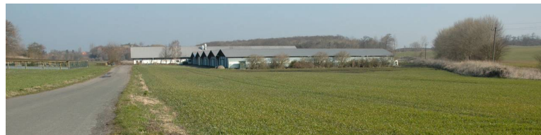
Eksempel på større staldanlæg fra 1970-erne, anlagt 3-400 m væk fra eksisterende gårdanlæg

Siloer kan virke som præcise elementer og give området karakter med en vertikal virkning.